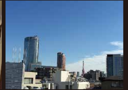
<ルーフバルコニー眺望>

日比谷線「広尾」駅徒歩8分 JR山手線「渋谷」「恵比寿」駅バス10分 バス停「東京女学館前」徒歩2分