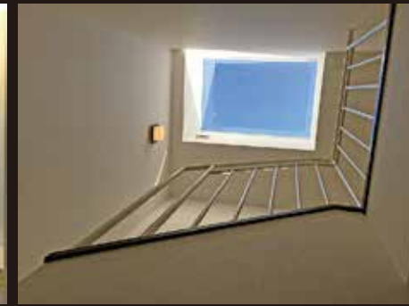
<階段部分トップライト>